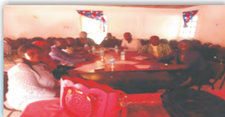
Équipe de La Gambie: Réunion de Planification et d'Examen du Comité de Pilotage Local

après de 915 personnes s'occupant d'enfants de moins de 5 ans. Les membres de la communauté ont été recrutés dans les districts d'intervention et formés en mai-juin 2019. L'Équip des Trois Pays a réuni les parties prenantes des écoles d'intervention pour un dialogue communautaire sous le thème Violence et Intimidation, Environnement Sûr, et Égalité de Genre et Sexualité de Genre. Le dialogue a lancé une conversation sur la socialisation des genres et les problèmes de santé reproductive découverts au cours de leur travail sur le terrain. Les élèves des écoles ont utilisé la photo-voix comme outil pour illustrer les questions relatives à la socialisation des genres et aux normes de genre identifiées dans leurs écoles et communautés.