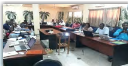
Équipe Sénégal : Formation des prestataires de santé dans le district sanitaire de Kédougou, avril 2019