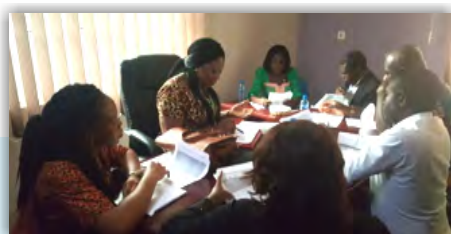
Équipe Nigéria: Engageant les parties prenantes à concevoir des stratégies de mise en œuvre pour fournir des informations sur la SRH aux adolescents de l'État d'Ebonyi

organisé des ateliers avec des représentants des départements engagés dans la santé maternelle, infantile et adolescente pour consolider les projets de protocole et élaborer des plans de mise en œuvre. L'atelier résidentiel de deux jours a réuni tous les membres de l'équipe de recherche, représentants du département impliqué dans la promotion de la santé maternelle, infantile et juvénile et experts en recherche. Dans le cadre de la mise en œuvre du projet dans les districts sanitaires d'intervention de Thiès et de Kédougou, une mission de formation du personnel de santé, des forces de défense et de sécurité a été menée sur le Système d'information sanitaire pour la gestion, les données de routine et les usages de la plate-forme DHIS2.