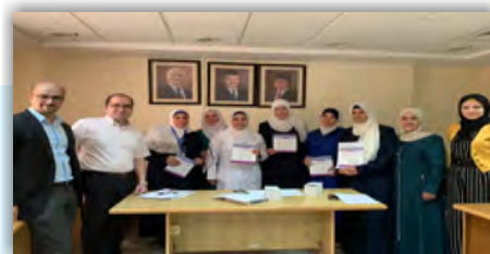
Équipe Jordanie-EMPHNET : à la réunion du Groupe de Travail sur la Santé Reproductive à Istanbul