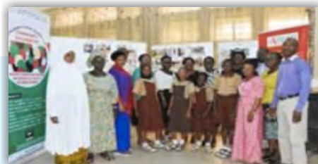
Équipe de Trois Pays: Parents et Enseignants au Dialogue Communautaire