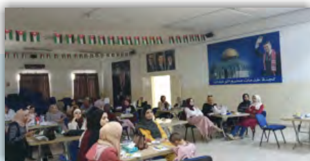
Équipe Palestine: Étude qualitative Phase

Gazentip, Turquie. Le résumé de l'Équipe Jordanie-EMPHNET sur la Création d'un Registre Harmonisé de Santé Reproductive pour améliorer la santé maternelle et infantile a été accepté à la Réunion Régionale du Groupe de Travail sur la Santé Reproductive, 2019 à Istanbul, Turquie, et la Réunion du Groupe de Travail Inter-Agences 2020, Thaïlande. L'Équipe Jordanie-JSANDS présentera son article sur la mise en œuvre réussie du système de surveillance des décès à la 16e Conférence Internationale ACS/IEEE sur les Systèmes et Applications Informatiques (AICCSA) 2019.