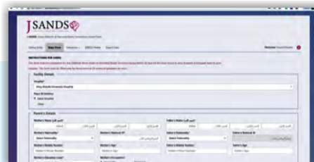
Équipe Jordanie-JSANDS: Aperçu du système et du logiciel