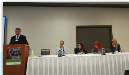
Conférenciers à la 25 ème Conférence Canadienne sur la Santé Mondiale, Octobre 2019