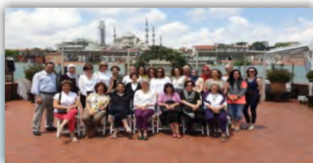
Équipe Jordanie-JSANDS: Ateliers de formation pour les points focaux de JSANDS