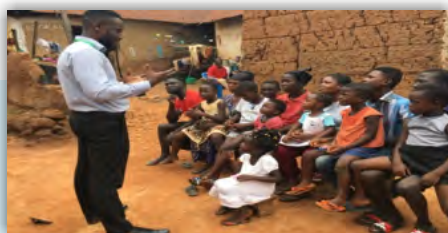
Équipe du Ghana: Un membre de l'équipe d'étude interagissant avec certains soignants